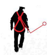
Fall FACTOR 1

anchor point located at the same level of the back anchor point of the harness